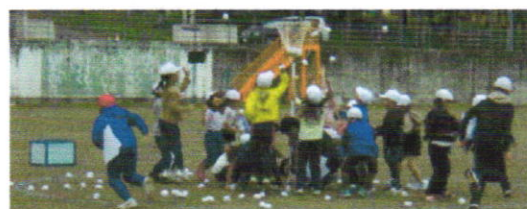
1年生 玉入れの練習の様子

また、お互いが気持ちよく過ごせるようルールを守ってご観覧いただけますようお願い申し上げます。