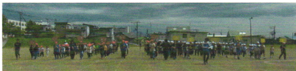
開会式練習 入場の様子